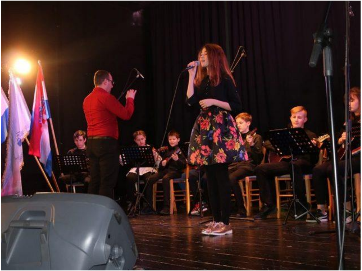
- 05.03.2020. – Koncert Zagrebačkog gitarskog trija