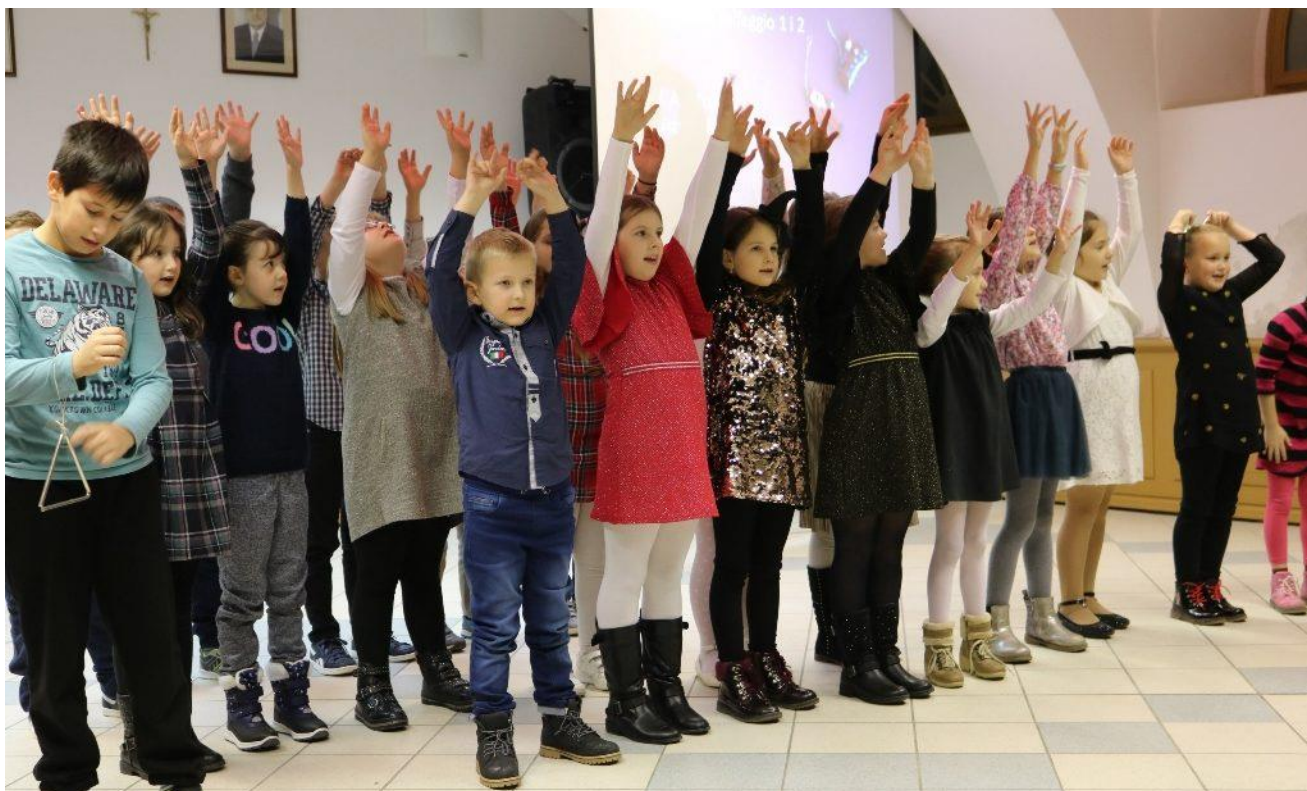
- 16. 12. 2019. – koncert u Domu za starije i nemoćne Marino Selo