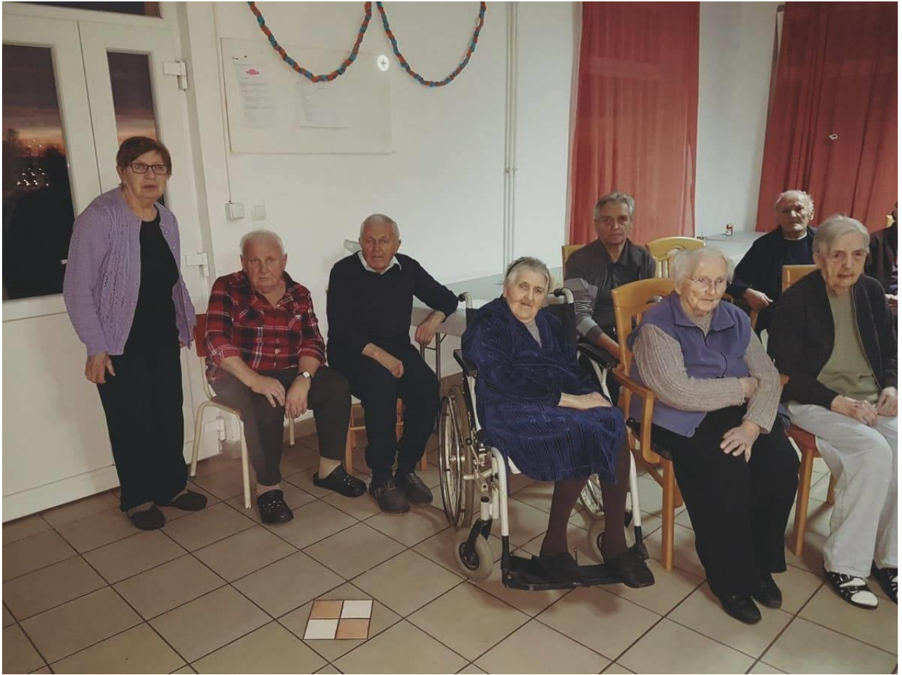
- 17.12.2019. – Božićni koncert u Crkvi UBDM